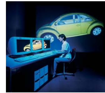
Photorealistisches Echtzeitrendering in einer CAVE-Umgebung