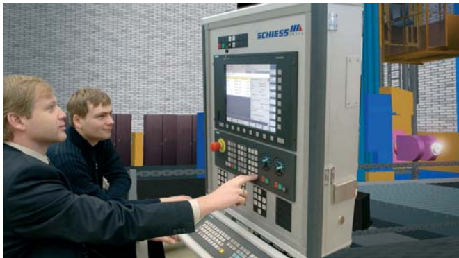
Nutzung der realen CNC-Steuerung für die Interaktion mit dem virtuellen Modell