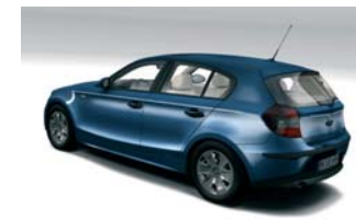
Photorealistisches Rendering eines Automobilmodells

Ein wichtiger Aspekt, der OpenSG von anderen Szenegraph-Implementierungen unterscheidet, ist die Fähigkeit der Parallelisierung (Multi-Threading). Ebenso kann OpenSG besonders gut auf einem PC-Cluster, einem Verbund von mehreren PCs, eingesetzt werden. Diese Eigenschaft ist z.B. dann wesentlich, wenn ein Projektionssystem mit mehreren Projektoren betrieben wird (z.B. eine CAVE oder eine gekachelte Projektion). Neben der Verteilung unterstützt OpenSG die netzwerk-basierte Kommunikation und Synchronisation des Renderingprozesses in großen PC-Cluster mit etwa 50 PCs.